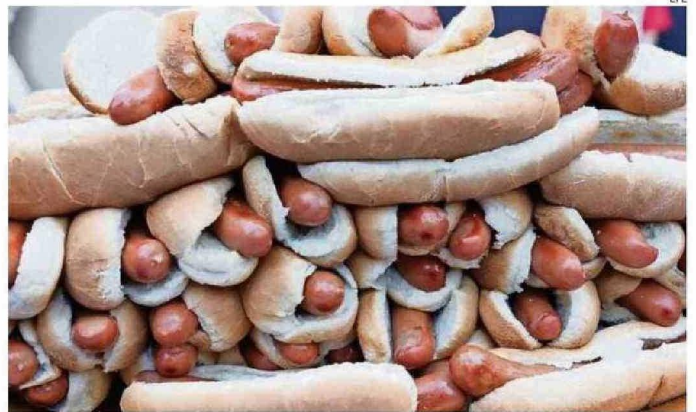
LOS INVESTIGADORES E HARVARD DEFINIERON TOCINO, HOT DOG O MORDADELA COMO CARNE ROJA PROCESADA.

La carne roja tiene un alto contenido en grasas saturadas y en estudios anteriores "se ha demostrado que aumenta el riesgo de diabetes de tipo 2 y de