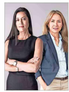
La abogada (izquierda) es parte de cuatro mesas y la vicepresidente de la CPC, de tres.

Tras cerrar su gira europea el viernes, el trío italiano de pop lírico Il Volo viajó a Chile para participar en la Teletón 2024 en la Quinta Vergara, en Viña del Mar. En la imagen, Ignacio Boschetto, uno de sus integrantes, saluda al niño embajador y a su familia. La campaña vivió difíciles momentos durante la tarde debido al lento ritmo de los donativos. "Estamos bajos", dijo Don Francisco cuando aún se estaba lejos de la meta de $38 mil millones. | C 16 y C 17