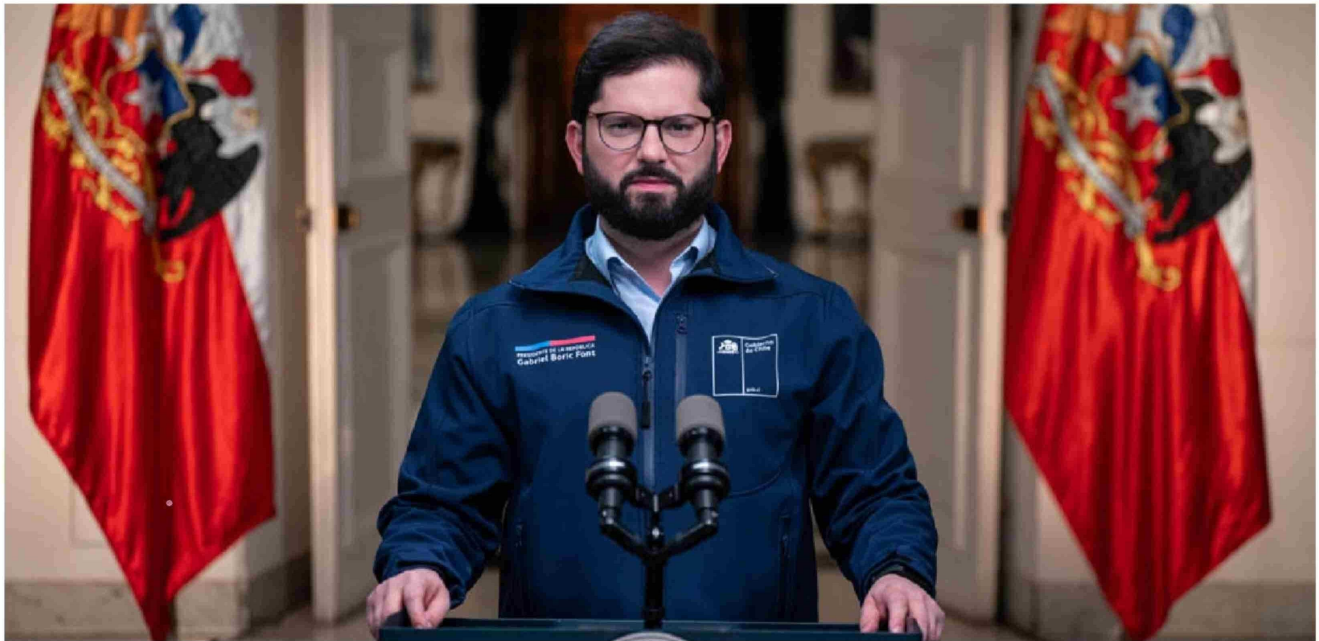
► Ahora que el proyecto fue presentado por parte del Presidente Boric, La Moneda apostará por un fuerte despliegue en la materia.

GABRIEL BORIC, PRESIDENTE DE LA REPÚBLICA