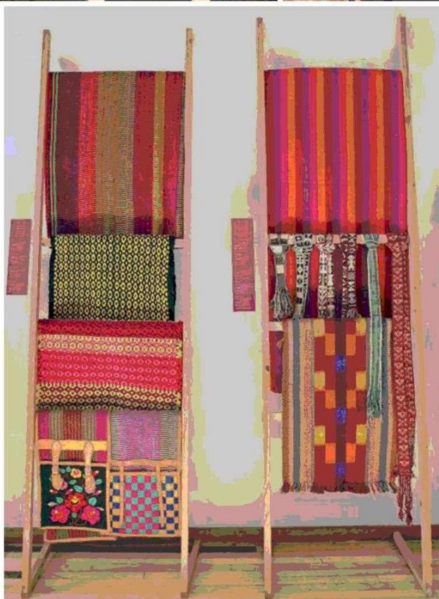
Las bolsas llamadas chuspitas o talegas son creaciones del norte de Chile, tejidas con lana de alpaca.