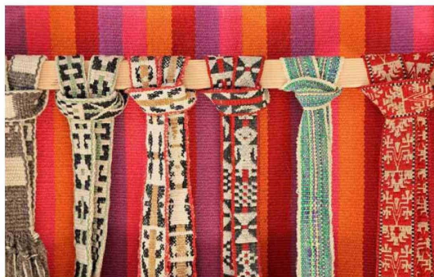
Serie de trariloncos (cintillo), faja y trarihues (cinturones) de La Araucanía. Hechos en telar vertical huirtral.

Texto, Soledad Salgado S.