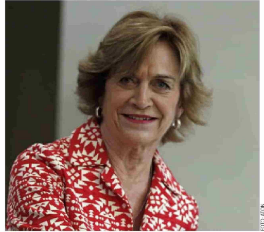
► Alcaldesa Evelyn Matthei, abanderada presidencial de la UDI.

Chile Vamos celebró el triunfo obtenido en municipios emblemáticos que le dan un piso a Evelyn Matthei -candidata que se mantiene en la pole position de las encuestas- para afrontar con mayor tranquilidad una ruta a La Moneda. Los resultados de ayer también remecieron las piezas en el oficialismo.