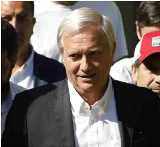
► José Antonio Kast, líder del Partido Republicano.