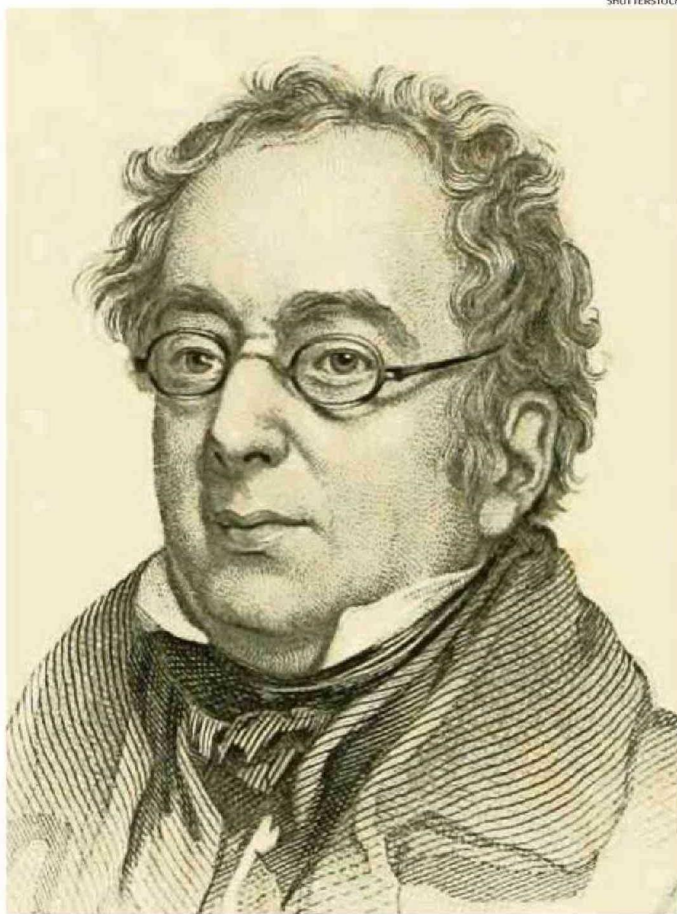
ISAAC DISRAELI PUBLICÓ “CURIOSIDADES DE LA LITERATURA” EN CUATRO TOMOS, ENTRE 1791 Y 1823.