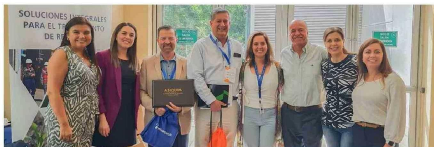
Hidronor participó, con un grupo de sus especialistas, en la feria de productos y servicios sustentables para la industria química.