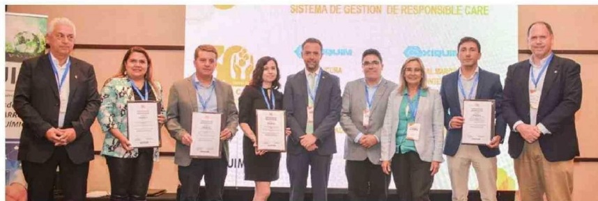
El equipo de Oxiquim que celebró la reverificación de las plantas Quilicura y Escudrón, y terminales marítimos Quintero y Escudrón.