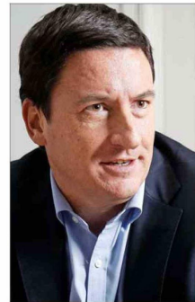
El presidente de Republicanos, Arturo Squella

Por otro lado, hoy la instancia será con parlamentarios de Renovación Nacional (RN) desde donde dicen que esperarán que