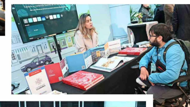
Las diversas fundaciones que participaron del encuentro explicaron los proyectos que están impulsando para la revitalización de los espacios públicos.