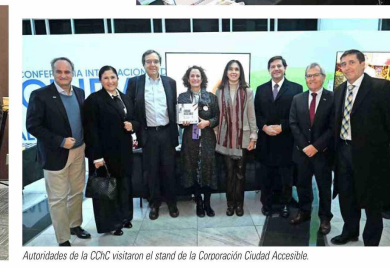
Autoridades de la CChC visitaron el stand de la Corporación Ciudad Accesible.