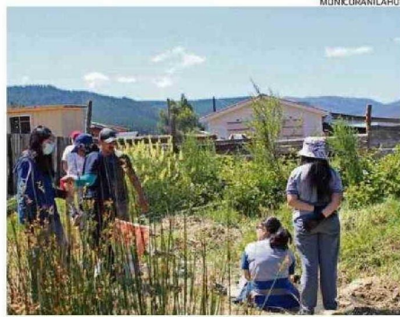
Humedales promueven servicios paisajísticos y de recreación.

pecies vegetales y animales que en general es difícil de encontrar en otros ecosistemas. Adicionalmente, canalizan la escorrentía y reducen el impacto de inundaciones sobre la infraestructura, facilitan la recarga hacia las aguas subterráneas y el intercambio de nutrientes, ayudan a filtrar contaminantes, mejorando la calidad de las aguas, y promueven servicios paisajísticos que conducen a