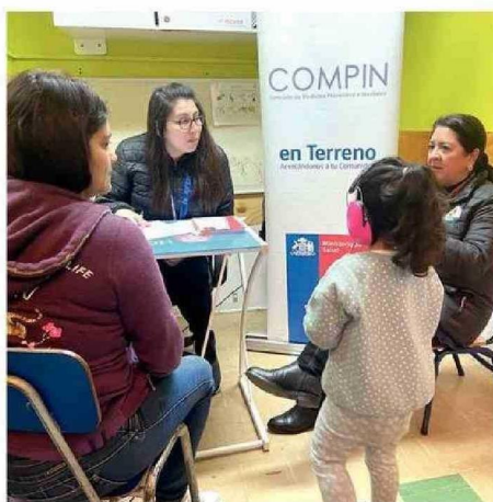
SE EVALUÓ EL GRADO DE DISCAPACIDAD DE LOS NIÑOS.

“A partir de esta resolución de discapacidad emitida por Compín, las