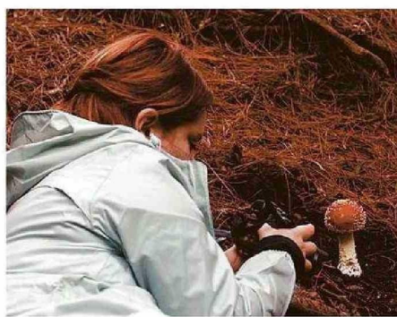
EL “FUNGITURISMO” ES UNA PRÁCTICA INTERNACIONAL.

-En la Región de Valparaíso, ¿cuáles son los hongos más comunes? ¿Hay algunos comestibles?