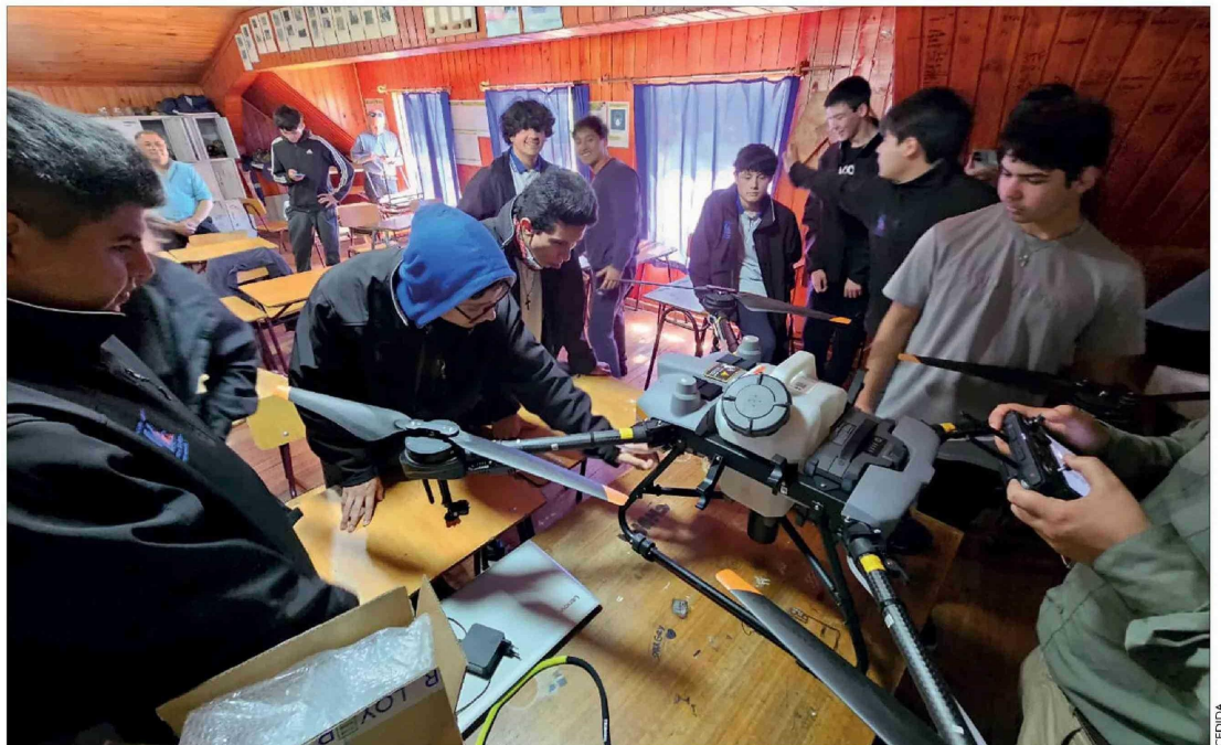
La especialidad de manejo de dron para el agro es escasa y bien pagada.

"Con este equipo, ellos pueden aprender a volar los drones pulverizados y poder hacer aplicaciones en