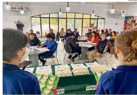
UNA VEINTENA DE PERSONAS PROBÓ LA LECHE Y SUS EFECTOS.