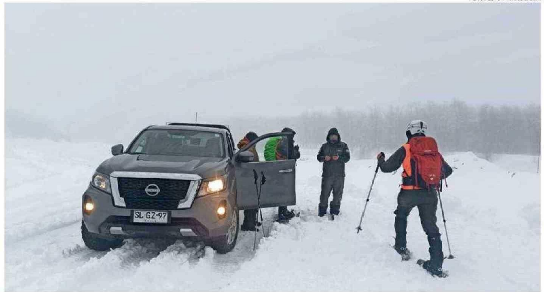
EL FIN DE SEMANA, EL TRABAJO DE BÚSQUEDA MOVILIZÓ A CARABINEROS, PERSONAL DE EJÉRCITO Y TAMBIÉN A EQUIPOS DE VOLUNTARIOS.

“Como Carabineros no nos vamos a restar, muy por el contrario, y lo he señalado, estamos haciendo un trabajo técnico que está liderado por equipos elite de Carabineros, que trabaja con cartografía, con imágenes satelitales, cámaras térmicas, helicóptero y con la georreferenciación de los teléfonos. Es decir, hay una amplia gama de recursos y especialidades dispuestas. También tenemos perros adiestrados en la búsqueda de personas, y va-