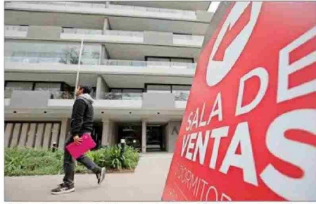
Chile es el segundo país del mundo donde hay más preocupación por las altas tasas de interés (41%), solamente superado por Colombia (49%).

costo del arriendo (35%) y el aumento de los costos de construcción (22%). Luego, con 21%, aparece el factor de que "no hay suficientes viviendas sociales".