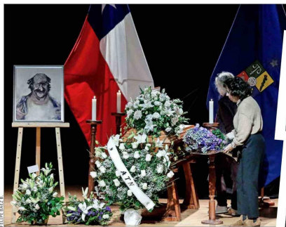
Durante la tarde de ayer, el escritor fue velado en el Teatro Nacional Chileno en una ceremonia organizada por la Universidad de Chile, que dio a conocer la noticia de su muerte.

"Gracias, maestro, por la vida vivida. Por los cuentos, las novelas y el teatro. Por el compromiso político. Por 'El show de los libros' que amplió las fronteras de la literatura. Por soñar que la nieve ardía en el Chile que te dolió tanto", declaró ayer en su cuenta de X el presidente Gabriel Boric al conocerse la muerte del escritor, a los 83 años. Afectado por un cáncer al estómago en 2016, en los últimos años Skármeta llevaba una vida retirada; había publicado su último libro en 2015, "Libertad de movimiento". Pero no había dejado de estar presente, como lo demostró la gran cantidad de mensajes en redes sociales de la comunidad literaria y en el velorio que