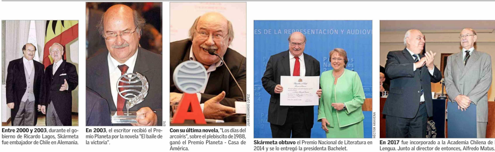
Entre 2000 y 2003, durante el gobierno de Ricardo Lagos, Skármeta fue embajador de Chile en Alemania.