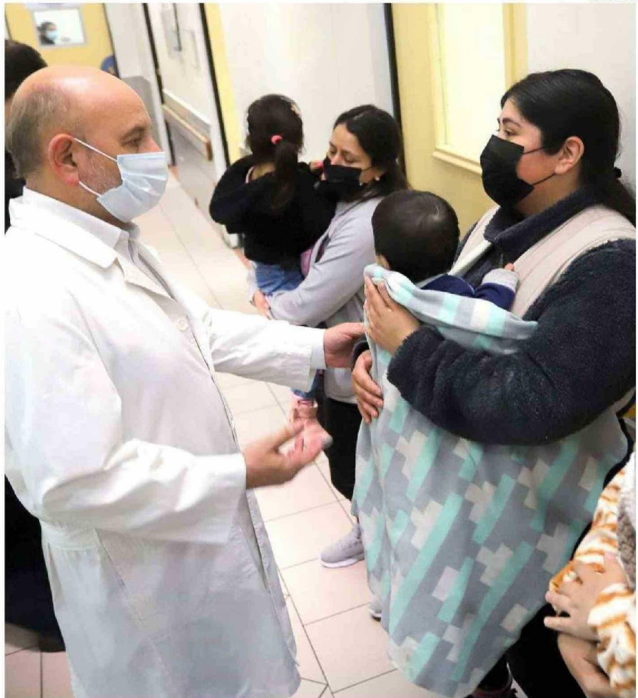
LA SALUD ES LA PREOCCUPACIÓN CENTRAL DE LA COMUNIDAD.