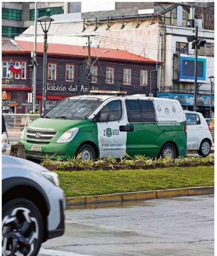
LA DELINCUENCIA ES LA SEGUNDA PREOCUPACIÓN DE LAS PERSONAS EN ESTE TERRITORIO.

De ahí que la relevancia de que la fundación y la USS aborden esta materia, en el sentido de que permite propiciar que los responsables se sienten a conversar para generar medidas que sean dirigidas para beneficio de la población.