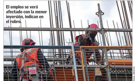
El empleo se verá afectado con la menor inversión, indican en el rubro.

El director ejecutivo de la ADI afirmó que “la inversión solo re-