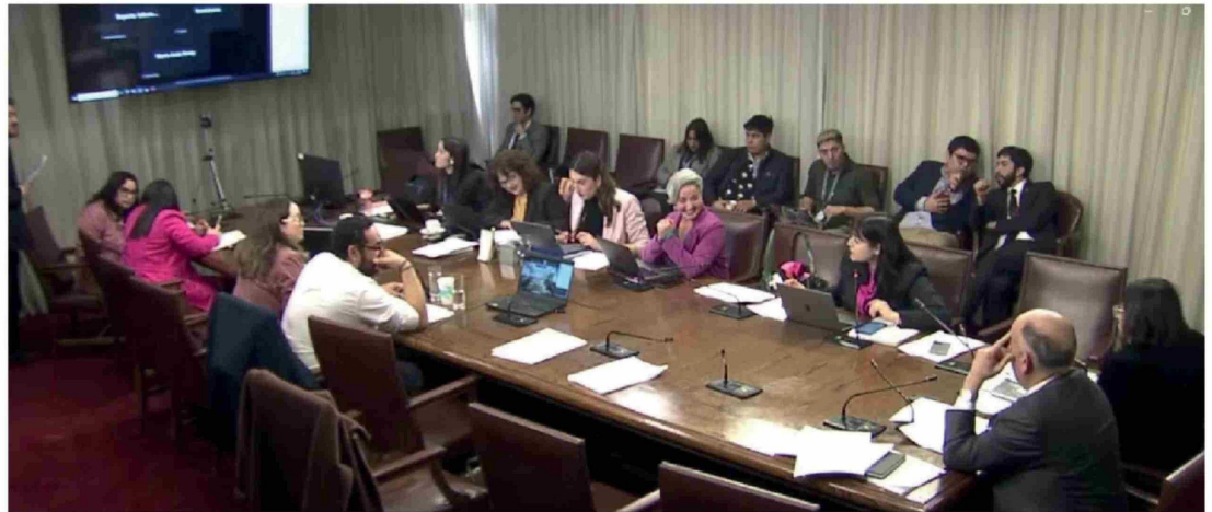
EN LA SESIÓN DE LA COMISIÓN de Educación de la Cámara, el propio ministro Nicolás Cataldo barajó la posibilidad de solicitar un administrador externo en el establecimiento.

Por otra parte, el director del DAEM y el alcalde de Los Ángeles aseguraron tener disposición al diálogo, aunque el jefe comunal reclamó falta de comunicación con los estudiantes y apoderados.