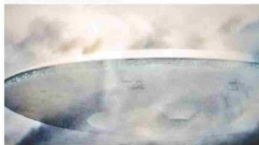
Ovní en Magallanes Antártico.

gallanes antártico podemos mencionar como ejemplos: Del 7 de junio al 3 de julio de 1965 un Ovní en la Isla Decepción, en Antártica. Un grupo de oficiales chilenos, británicos y de otras nacionalidades observaron una gran luz que volaba de ma-