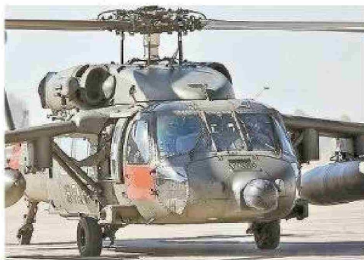
Helicóptero Black Hawk.