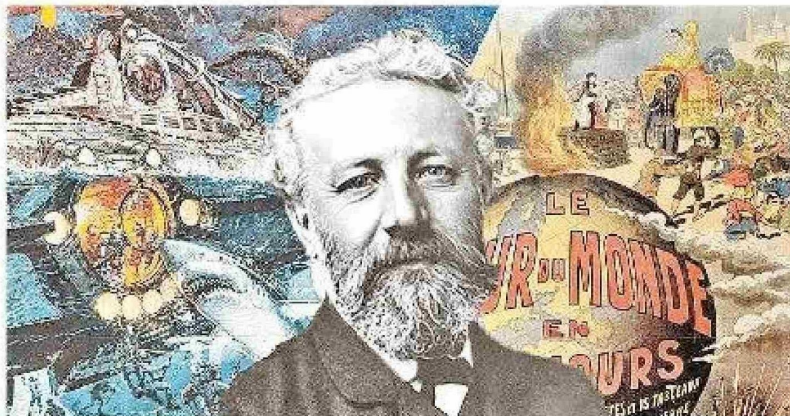
Julio Gabriel Verne.

El Albatros tenía características similares a lo que hoy son los helicópteros, razón por la que se le atribuye a Verne haber predicho la invención de estos vehículos aéreos. El primer vuelo libre del helicóptero o Gyroplane fue realizado el 13 de noviembre de 1907, que estaba sujeto por técnicos y sólo