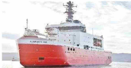
Rompehielos antártico Oscar Viel.

Verne, será el primer ufólogo. Fue uno de los primeros en describir internacionalmente, un Ovní (Objeto Volador No Identificado) y Osni (Objeto Sumergible No Identificado). En cuanto a su cumplimiento en Ma-