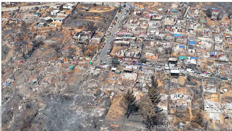
Siniestro. La detención de otros cuatro imputados en el megaincendio, todos ellos con vínculos con Conaf, desató interrogantes sobre los alcances de la organización que causaba siniestros forestales para trabajar horas extras.