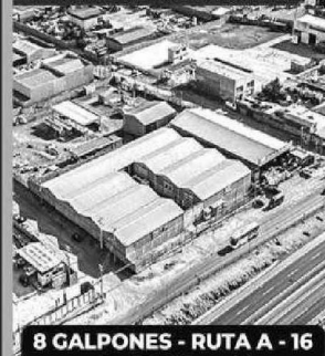
TERRENO EN ALTO HOSPICIO

8 GALPONES - RUTA A - 16 4.200m2 UF 40.000