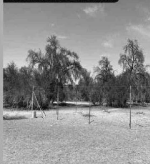
TERRENO POZO ALMONTE