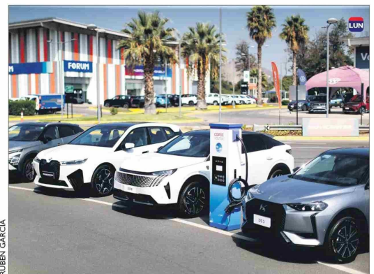
Unas 40 marcas participan en el mercado de los vehículos eléctricos enchufables.

nación de virtudes está solucionando el tema de los puntos de carga".