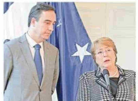
Jorge Flies fue intendente durante el segundo mandato de Michelle Bachelet. Las fotografías muestran tres momentos de aquel período: inaugurando las nuevas dependencias del Centro de Rehabilitación en 2016 (a la izquierda); entrando a una reunión del gabinete regional (al centro); y anunciando el Plan Especial de Zonas Extremas (a la derecha).