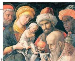
Posiblemente los reyes magos eran sabios entendidos en los astros, venidos de Babilonia. Pintura de Andrea Mantegna.