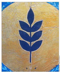
Delicados detalles (algunos de arte textil, en metal o cerámica) incluyen los sagrarios, como el realizado por Sofía Izquierdo.

Pequeño recinto, normalmente, con forma de capá o armarito, el sagrario se utiliza desde el Medioevo para guardar