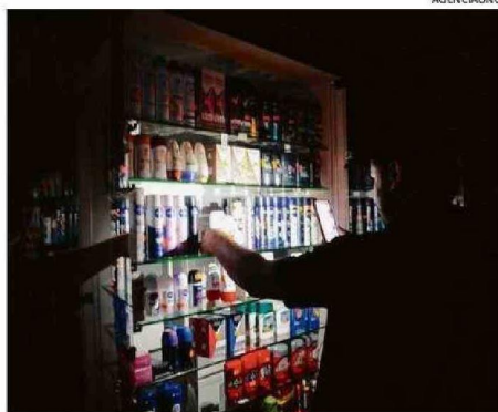
LA EMERGENCIA NO QUEDÓ RESUELTA ANOCHÉ.

zaron registros con personas atrapadas en algunos de los juegos.