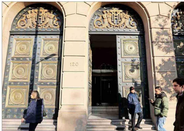
Las estadísticas de Dipres muestran que el sobrecosto del endeudamiento seguirá creciendo hasta el año 2028.

Se estima que en 2024 estos desembolsos superarán los US$ 3.700 millones. En el tercer trimestre este tipo de pagos se aceleró y sumó a US$ 1.286 millones. Analistas alertan por cifras.