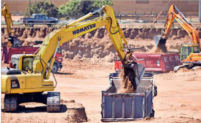
La construcción fue el sector que terminó el año con la menor confianza empresarial. El subindicador se registró en 29,17 puntos en diciembre.

La confianza empresarial registró su peor desempeño del 2024 en diciembre, y acumula casi tres años en terreno negativo.