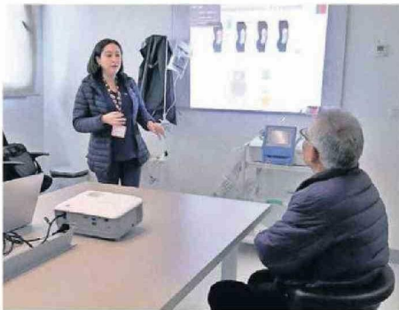
ACTUALMENTE ATIENDEN A 17 PACIENTES.

En relación al programa, Jamett lo calificó de muy bueno porque está la