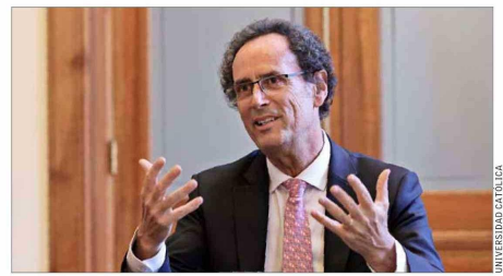
Es profesor titular en el Depto. de Ing. Estructural y Geotécnica e investigador del Centro para la Gestión del Riesgo de Desastres (Cigiden).

que viene, declaró que “este es un período extraordinariamente desafiante para la universidad porque es extraordinariamente desafiante para Chile. En este momento se están jugando valores fundamentales de la sociedad chilena que tienen que