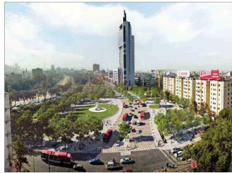
Un apoyo decidido dará al proyecto de Nueva Alameda.