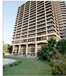
El nuevo MUT que se evalúa en el edificio de Enel, tiene lugar importante en su agenda.