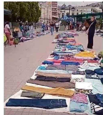
COMERCIO EL DOMINGO EN LA PLAZA O'HIGGINS.

El primero consiste en realizar un catastro de las personas que trabajan en el sector, con el fin de obtener una hoja de ruta que identifique los puntos más críticos de la zona. Según el municipio porteño, actualmente se encuentran en