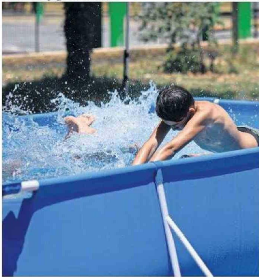
INFECCIONES Y ASFIXIAS POR INMERSIÓN AUMENTAN EN VERANO.