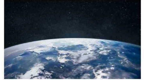
MÁS DEL 80% DEL AGUA DE LA TIERRA PODRÍA ESTAR EN SU INTERIOR.