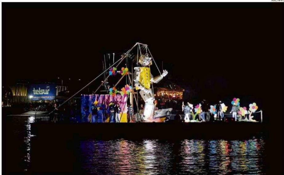
A LAS 21:30 HORAS DE MAÑANA ESTÁ PREVISTO EL INICIO DEL CORSO FLUVIAL POR LAS AGUAS DE LOS RÍOS VALDIVIA Y CALLE CALLE.

competirán en el curso fluvial, que entregará premios en dinero a los tres primeros lugares de cinco categorías. Los montos van desde $1.400.000 a $2.800.000.