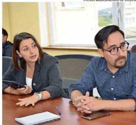
AYER FUE LA REUNIÓN DE COORDINACIÓN DE SEGURIDAD.

Ante la realización de este evento, tanto Carabineros como el municipio dispondrán de stands en los que se entregarán pulseras de identificación a niños y personas mayores, con el fin de facilitar su reencuentro con familiares o grupos de turistas en caso de extravío.