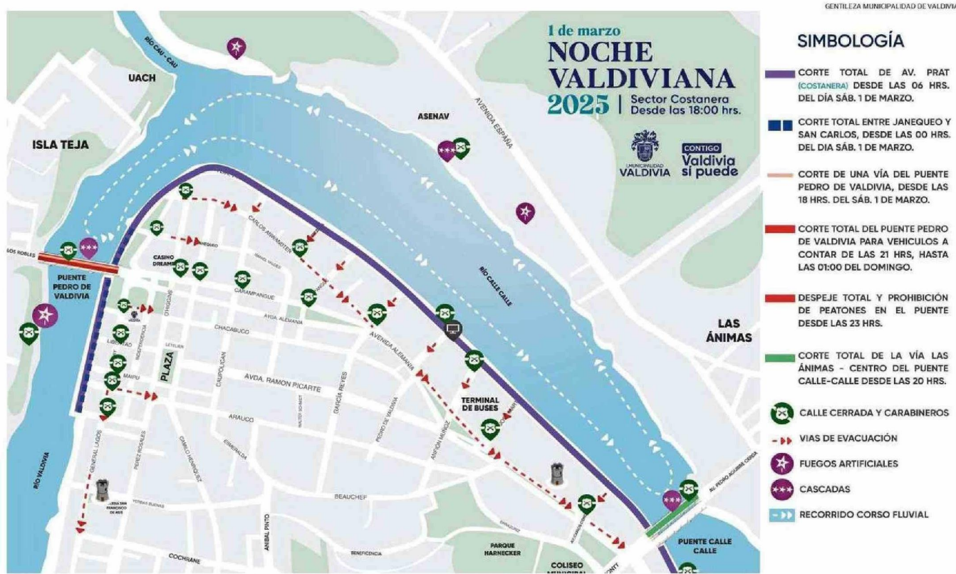
IMAGEN DISEÑADA POR LA MUNICIPALIDAD DE VALDIVIA QUE DA CUENTA DE LOS DISTINTAS ACCIONES INVOLUCRADAS EN LA JORNADA DE CONVOCATORIA MASIVA.

CELEBRACIÓN. Mañana y hasta las 2:00 A.M. del domingo no estará permitido el tránsito vehicular por la Avenida Arturo Prat. Organizadores informaron además de las restricciones que se aplicarán en los puentes Pedro de Valdivia y Calle Calle.