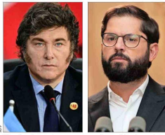
"Poniendo zurdos en su lugar", escribió el mandatario trasandino en X. Su par chileno le pidió "humildad".

Entre otros puntos, el Gobierno busca eliminar la norma que supedita un plan de regularización de inmigrantes a la aprobación del Congreso. | C 1