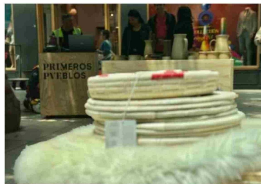
DESDE FINES DE DICIEMBRE, Primeros Pueblos ya está en Mallplaza Trébol de Concepción.