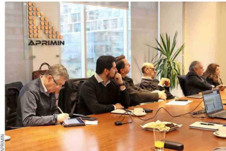
Reunión Comité de Inversiones, oficina Aprimin.

La evolución de los proveedores mineros ha sido destacable, hoy por hoy no solo entregan equipos y servicios, sino que se han convertido en colaboradores clave en la optimización de procesos, reducción de costos operacionales y minimización del impacto