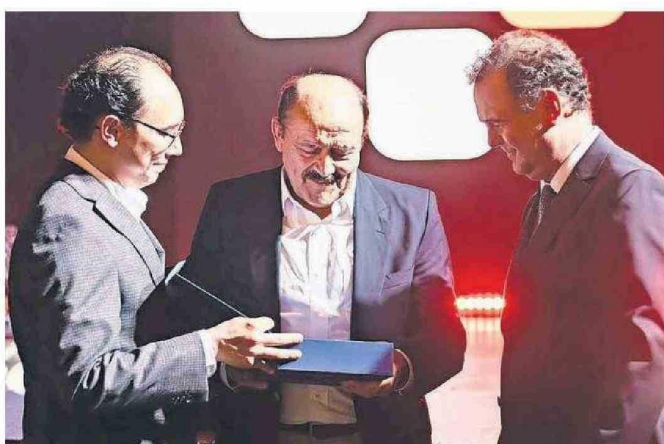
CON EMOCIÓN RECIBIÓ EL RECONOCIMIENTO, GRACIAS A LA VOTACIÓN DE SUS PARES DE LA MEDICINA.