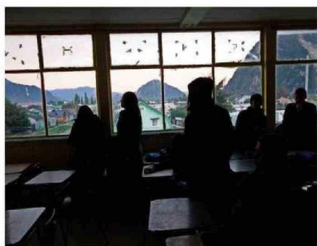
AUTORIDADES Y APODERADOS PIDEN ACELERAR PROCESO.

tes, se encuentran en conocimiento de la situación. En Ñuble se ha informado desde el mes de marzo, que la entrega de este beneficio se retrasaría, producto que las empresas participantes no presentaron ofertas válidas y por ello el proceso de licitación se declaró desierto", explicó.