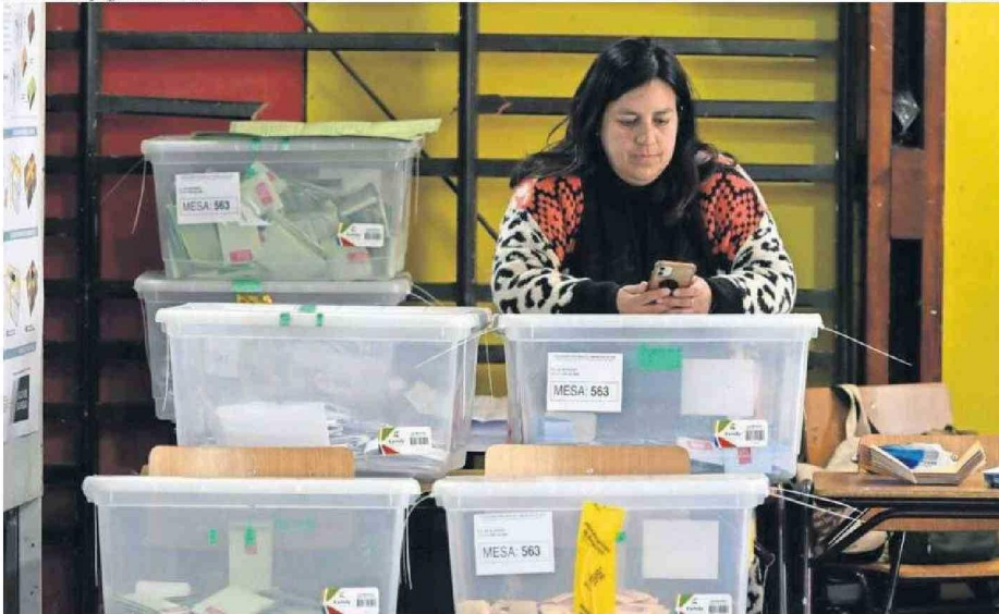
ESTUDIO CONSIDERÓ TAMBIÉN EL PANORAMA RESPECTO A LAS PASADAS ELECCIONES DE OCTUBRE.

observó la nueva composición del Concejo Municipal de Copiapó, dada su condición de capital regional de Atacama.