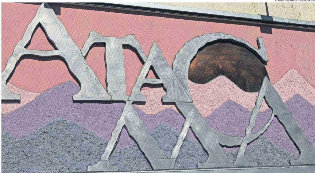
EL INSTITUTO RES PUBLICA TAMBIÉN OBSERVÓ EL PANORAMA POLÍTICO REGIONAL POSTERIOR A LAS ELECCIONES.