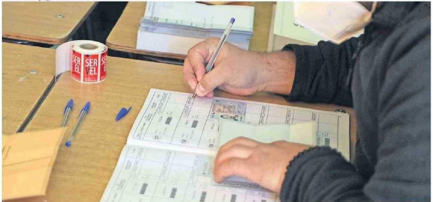
DESDE LA CONSULTORA NÓMADE INDICARON LA NECESIDAD DE FOMENTAR LA PARTICIPACIÓN Y VOTO EXTRANJERO.