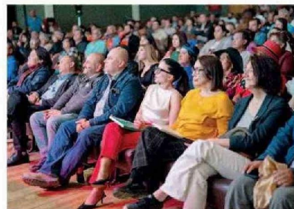
Con gran convocatoria se desarrolló esta actividad cultural.