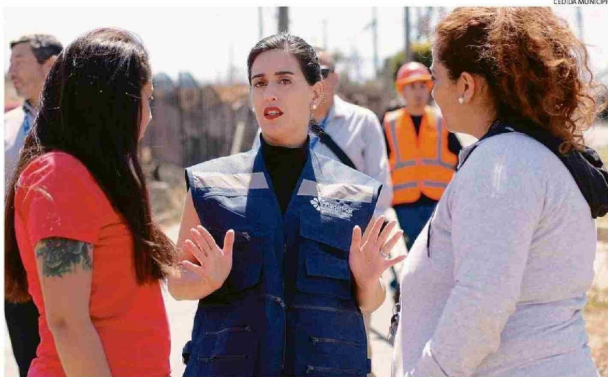
"CON EL EQUIPO EVACUAMOS A ALGUNAS PERSONAS ESE DÍA. ALGO QUE VA A QUEDAR GRABADO Y ES PARTE DE NUESTRA INTIMIDAD".

Ripamonti recuerda que pasada las 13 horas dio la instrucción directa a todos sus equipos de emergencia y de seguridad pública a ir a merodear las zonas de la interfaz urbana forestal. "Me tocó estar esa tarde y noche con el comandante del Cuerpo de