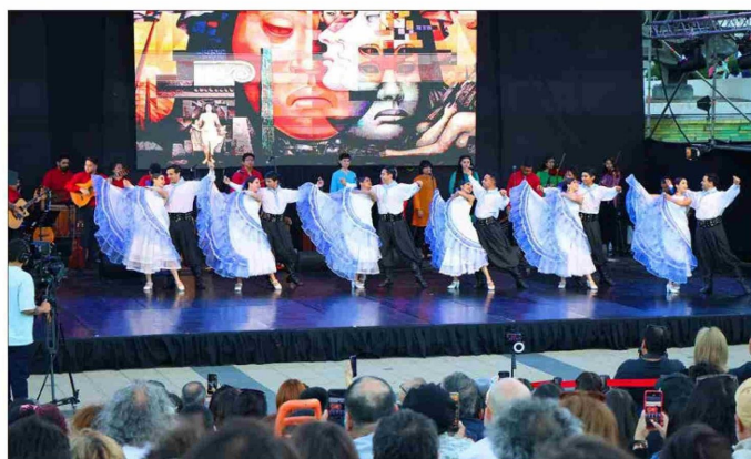
EL BALLET FOLCLÓRICO UDEC se presentó al cierre de la jornada de ayer, abriendo a la vez las actividades musicales y escénicas que tendrán como escenario el Foro.

La Pinacoteca fue el escenario donde el director ejecutivo de la editorial Fondo de Cultura Económica abordó a grandes rasgos la extensión universitaria y la necesidad de reavivar el interés por la lectura entre los adolescentes, entre otros temas. Esta primera jornada se cerró con la presentación del Ballet Folclórico UdeC en el Foro de la casa de estudios.