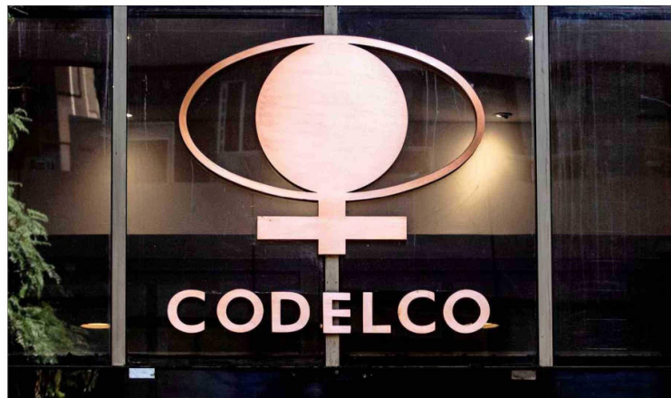
Los especialistas alertan de que una parte importante del endeudamiento de las empresas del Estado se explica por la situación financiera de la minera Codelco.