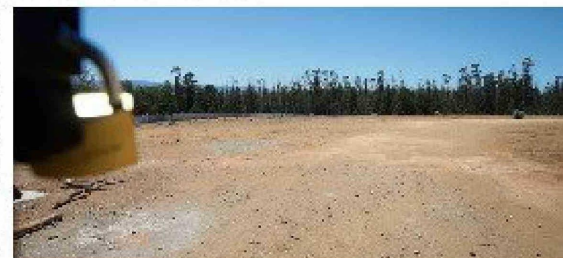
Este es el terreno donde se proyecta la construcción del nuevo centro de salud.

El terreno del nuevo Hospital de Pichilemu se ubica en Camino Antiguo Punta de Lobos y tiene una superficie de más de 30 mil metros cuadrados, la nueva ubicación es una de las razones del cambio del recinto, ya que el actual hospital se encuentra en una zona calificada como inundable ante la ocurrencia de tsunamis. ver