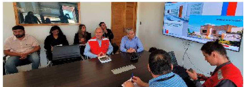
Recientemente autoridades del MOP se reunieron con las autoridades locales de Pichilemu