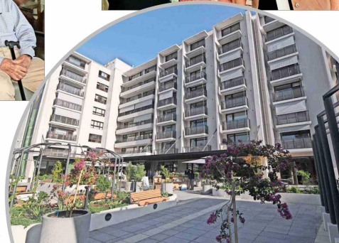
La nueva residencia El Rodeo se ubica en Avenida La Devesa, en la comuna de Lo Barnechea.