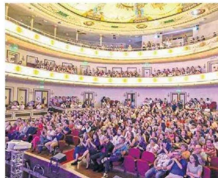
TEATRO YA HA TENIDO MARCHA BLANCA.

Algunas observaciones correspondían al atrio del recinto (hemiciclo), observaciones que no afectan al edificio del Teatro Municipal propiamente tal, las que se informó fueron reparadas por la empresa a cargo de las obras en enero y aprobadas el MOP.